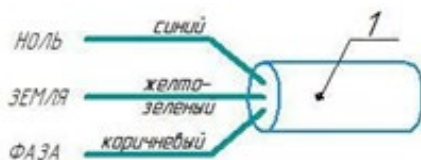
Рисунок 2 - Схема подключения к электросети

Внимание! Эксплуатация светильников без заземления не допускается! Корпус светильника электрически связан с проводом заземления кабеля питания. При этом, корпус светильника и кронштейн имеют изоляционное покрытие.